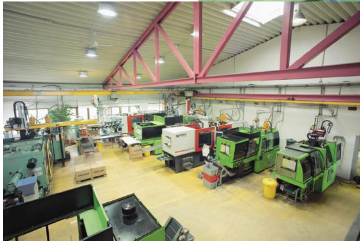
Seit 20 Jahren konstruiert und produziert die Greger GmbH Formen und Spritzgießteile. Anfang 2007 wurde die Produktionsfläche verdoppelt