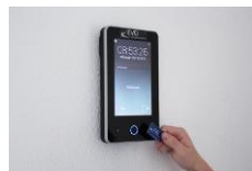
PZE-Terminal (7 Zoll)